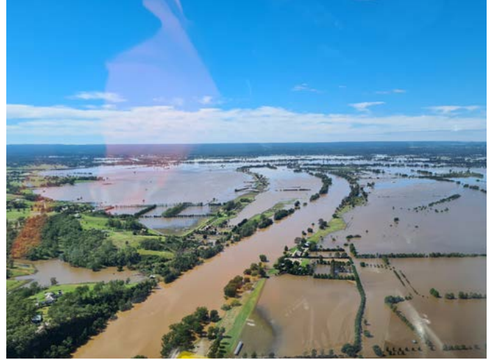
Hawkesbury River, Richmond |