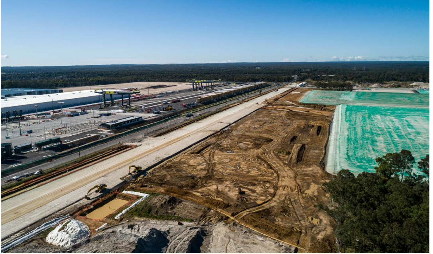
منظر جوي لـ Moorebank Precinct West يُظهر إنشاء طريق تحويل Moorebank Avenue.