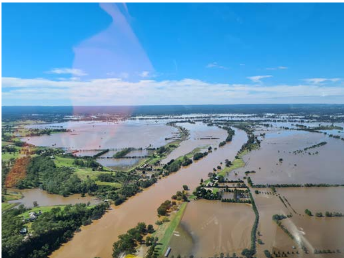
Hawkesbury River, Richmond

Đây là quang cảnh phơi bày của các trận lụt vừa qua tại vùng Tây Sydney. Steve từ Moorebank Logistics Park thuộc đội nối kết cộng đồng đã chụp hình này, từ máy bay trực thăng, trong lúc làm việc thiện nguyện với SES. Steve đã lấy vài ngày nghỉ để hỗ trợ công tác phục hồi và giúp cho chúng ta được an toàn. Cảm ơn bạn Steve!