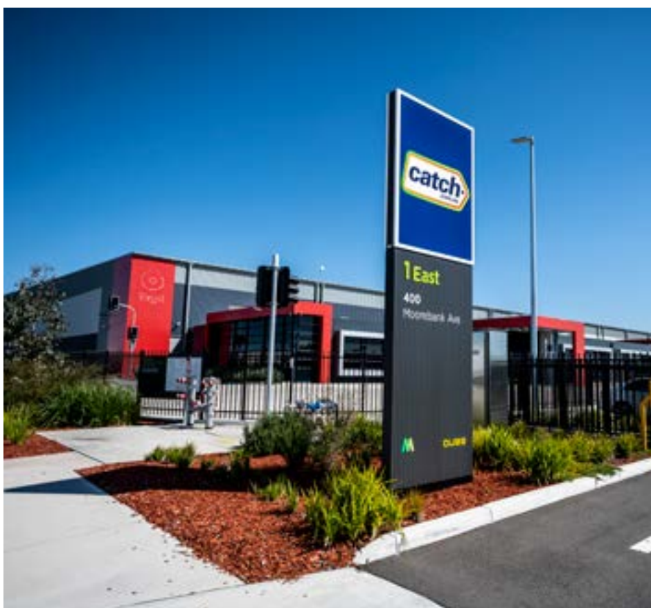
Ang 2021 ay naging isang matrabahong taon para sa mga magrerenta na naglilipat sa Moorebank Logistics Park.